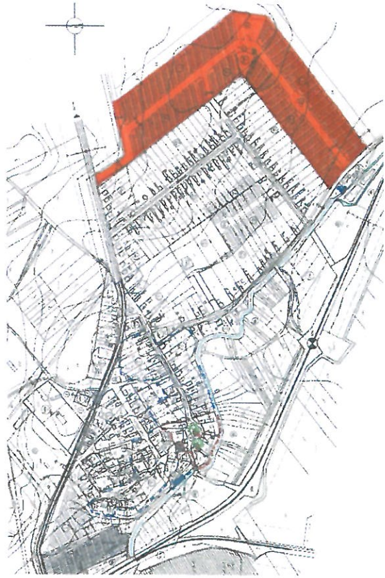
4.számú terület: Új beépítésre szánt terület /az Újtelep utca beépített oldala mögötti ék-i és dk-i terület /